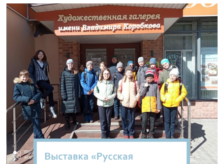
Выставка «Русская провинция»