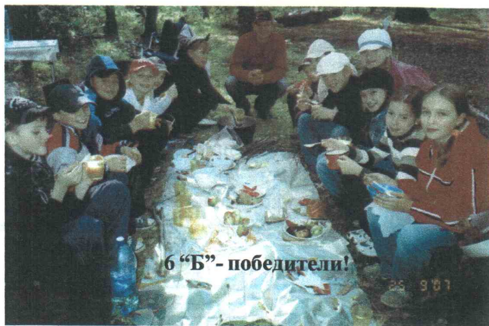
6 "Б"- победители!